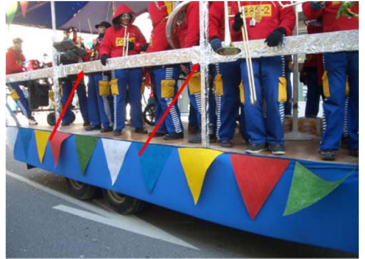
Sicherung der mitfahrenden Personen