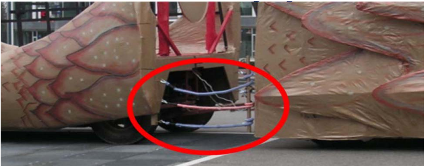
Eine gute Sicherung mit Gummiseilen zwischen Zugfahrzeug und Anhänger.